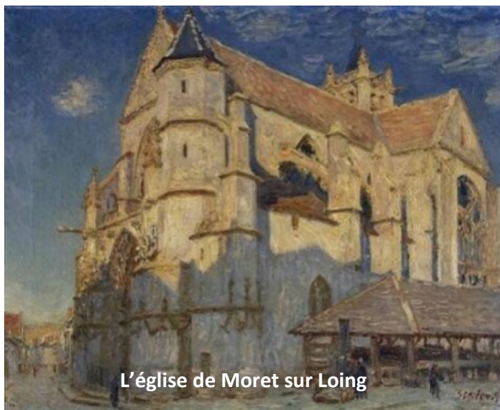
L'église de Moret sur Loing

Sur les traces de SISLEY, un parcours de 7 km, vous permet de découvrir de manière originale son œuvre. En flânant sur les chemins de Moret sur Loing, Saint-Mammès et Veneux-Les-Sablons, vous pourrez vous arrêter aux emplacements même où l'artiste a posé son cheval.